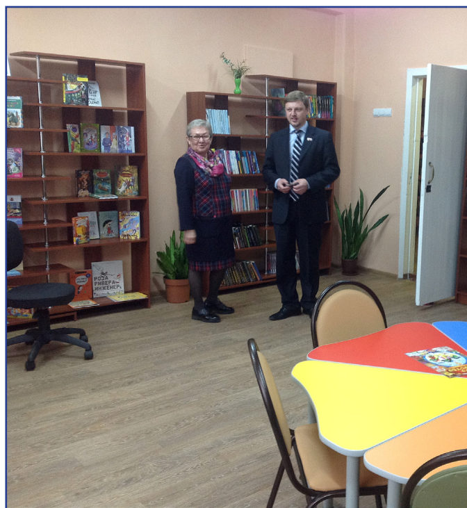
Закуплен линолеум для ремонта одного из залов библиотеки № 9.

11. Отремонтированы колодцы ливневой ка-