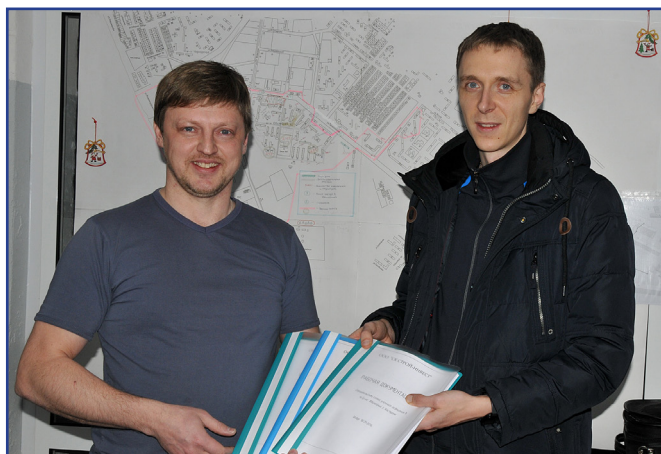
Автор проекта строительства линии освещения передаёт рабочую документацию