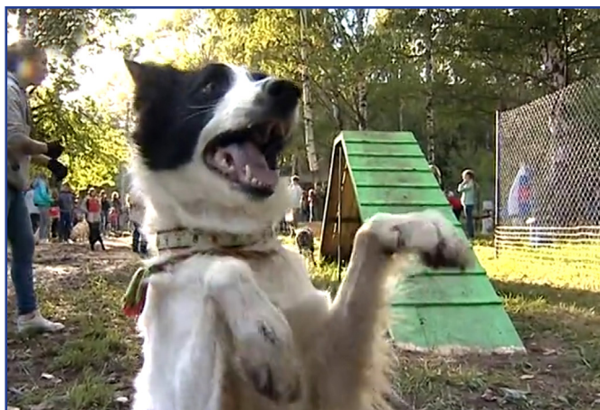
Четвероногие друзья и их хозяева рады открытию площадки

Реализован 1 этап этого проекта - оборудована и сдана в эксплуатацию площадка для дресси-