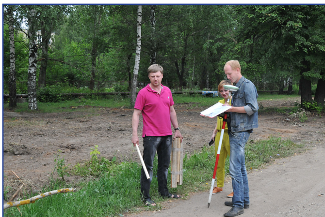
Со специалистами Управления архитектуры и градостроительства размечаем место площадки для дрессировки собак

1. Подготовлен и утверждён проект благоустройства микрорайона Юбилейный, предусматривающий организацию автостоянок на 89 мест (с перспективой расширения до 200 мест), спортивной и двух детских площадок, площадки для дрессировки собак.