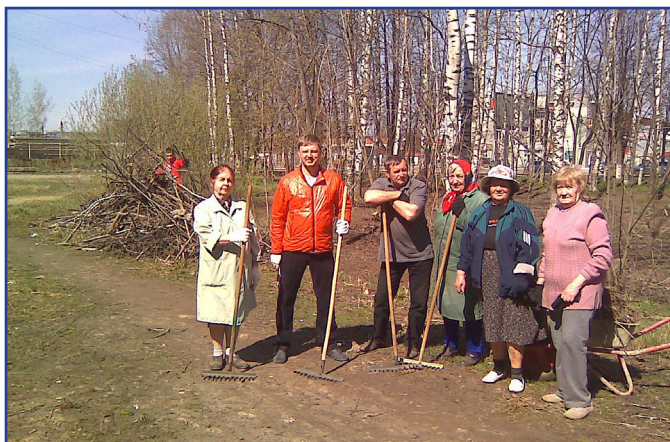
Поколение, воспитанное в советских традициях коллективизма, активно поддержало субботник в роще

4. Оказана помощь в спиле 3 деревьев в рай-