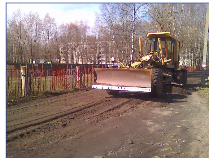
Весеннее грейдирование дорог по заявкам жителей

12. Произведена прочистка ливневой канализации в районе д. № 1 м-на Юбилейный.